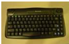
客室内キーボード