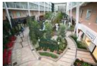
セントラルパーク

周りにはおしゃれなスペシャリティレストランやニューヨーク風のカフェ、バー、COACH のショップやアリュールには現代アート BRITTO のギャラリーがあります。