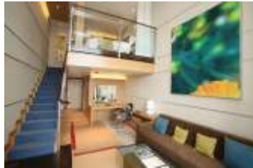
クラウンロフトスイート