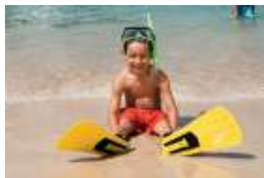
ショアエクスカーション(イメージ)