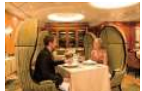
150 セントラルパーク

24時間のルームサービスを承ります。温かい軽食、サンドウィッチ、サラダ、フルーツなどもございます。メニューはキャビン内のご案内をご覧ください。(深夜のオーダーは1回$3.95のサービスチャージがかかります)