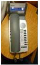
客室内電話(アリュール)

* アリュール・オブ・ザ・シーズの電話機の自動音声案内は乗客の国籍を認識して日本人の場合は日本語の案内になります。Wake-Up Call や Voice Mail(留守録の再生)などボタンを押すと日本語の案内があります。