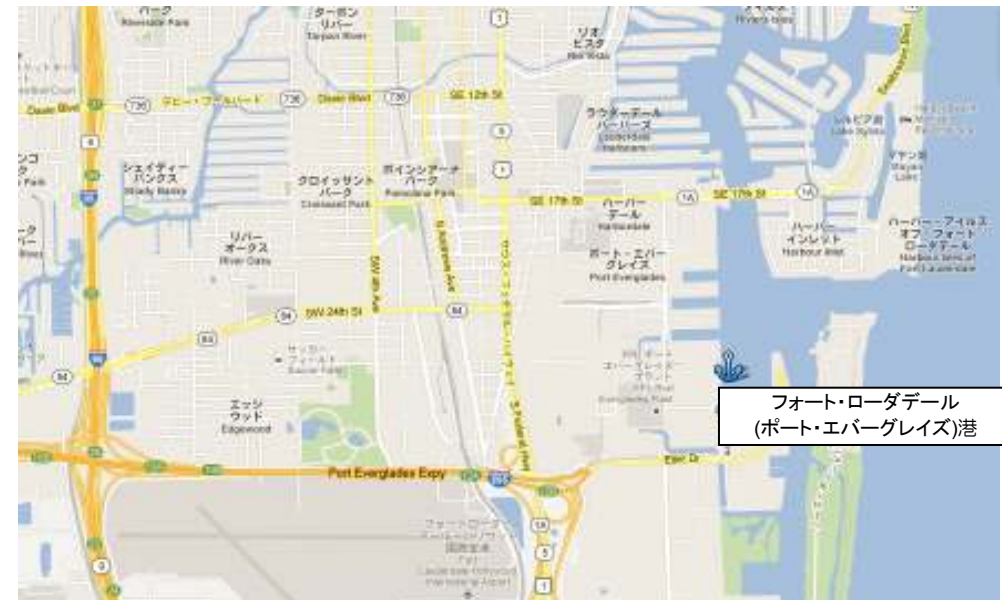
フォート・ローダーデール (ポート・エバーグレイズ)港

◆【マイアミ空港周辺・ダウンタウンから】 マイアミからタクシーで約 1 時間弱。ポート・エバーグレイズ港に入るまでに船名(とロイヤル・カリビアン・インターナショナルであることを合わせて伝えるとよい)をタクシードライバーに伝えてください。