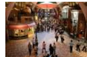
ロイヤル・プロムナード

深夜までオープンな船上の街。フリーダムクラス客船に比べ幅が約 2 倍と、より広々とした開放的な空間になりました。また 3 デッキ吹き抜けて、ガラスドームの天井からは自然光が明るく差し込みます。カフェやバー、免税店やジュエリー、お土産など何でも揃う色々なショップが並び、夜にはテーマナイトやパレードなどのイベントも行われます。