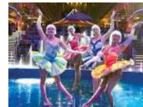
アクアシアターでのショー(イメージ)

洋上初めての海に面した野外円形劇場。最後尾に洋上最大・最深のプールが設置されており、オリンピック出場経験のあるプロや NCAA チャンピオンなどが音楽、光、噴水によって優雅なシンクロナイズドスイミングやドラマチックなダイビングを披露します。眼下に広がる大海原を見晴らす 600 席の座席からかつて上演されたことのない斬新なショーをお楽しみください。