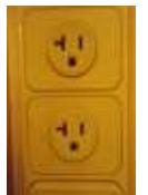
120ボルト (上を二股にして使用)

客室では120ボルトおよび230ボルトの電源が使用できます。日本の二股コンセントはそのまま差し込めます。バスルームのコンセントは電気シェーバーのみ使用可能です。日本の電化製品を長時間ご使用になる場合は変圧器をお持ちください。火災予防のため、アイロン、湯沸し器のご使用はご遠慮ください。