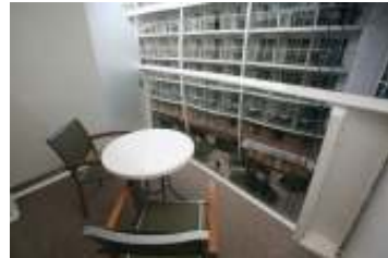
セントラルパークバルコニー客室のバルコニーからの眺め