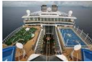
ゴルフとスポーツコート

アクアノーツ(3～5 歳)、エクスプローラーズ(6～8 歳)、ボイジャーズ(9～11 歳)