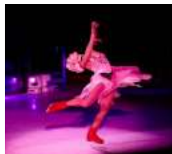
アイスショー(イメージ)

新たに ドリームワークスのキャラクター達が登場するミニ・アイスショーも加わりました。また、一般開放もされますのでカリブ海の洋上でアイススケートをお楽しみいただけます。貸しスケート靴および滑走料金は無料です。(登録要)一般開放の時間帯は船内でご確認ください。