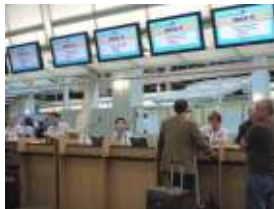
チェックインカウンター

係員が必要な情報を登録後、SeaPassをお渡しします。SeaPassは、客室のカギ、クレジットカードおよび身分証明書の機能がありますので大切に保管してください。(P8参照)