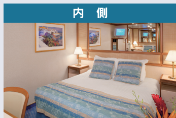
●内側ミッドシップ ●内側 【シャワー付き】 【約 15.6 m 2 】