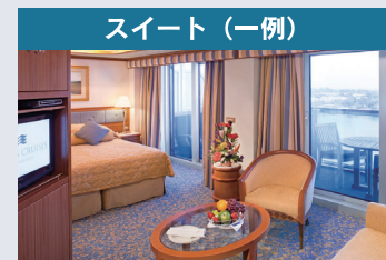
●ヴィスタ・スイート 【バルコニー、バスタブ、リビングエリア付】 【約 48.9 m 2 】 ●ファミリー・スイート 【バルコニー、バスタブ、リビングエリア付】 【約 39.8 m 2 】【定員：6名様】 ※ファミリースイートは4名様からの受付となります。