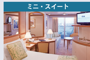
●ミニ・スイートミッドシップ ●ミニ・スイート ※一部シャワーのみの部屋がございます。 【バルコニー、バスタブ、リビングエリア付】 【約 32.8 m 2 】