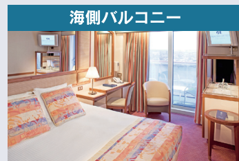
●プレミアム海側バルコニー ●海側バルコニーミッドシップ ●海側バルコニー 【バルコニー、シャワー付】 【約 22~25.7 m 2 】