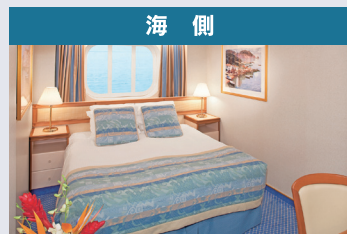
●海側プレミアム ●海側 ●海側（視界が遮られます） 【窓、シャワー付き】 【約 17~18.3 m 2 】